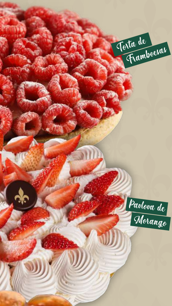
Torta de Framboesas