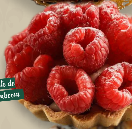
Tartelette de Framboesa