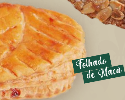
Folhado de Maçã