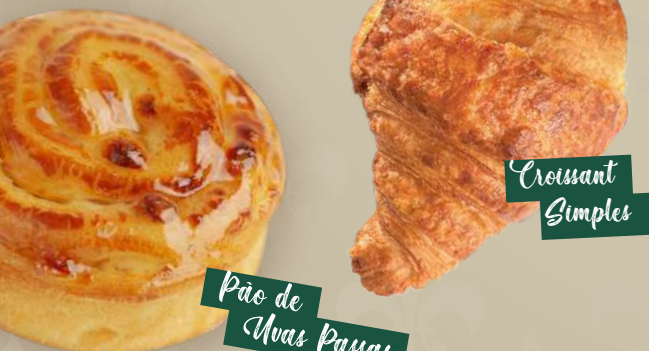
Pão de Uvas Passas