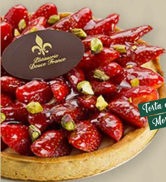
Torta de Morangos