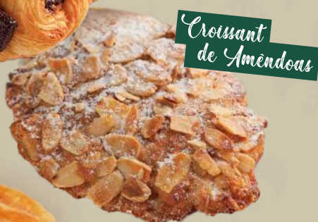
Croissant de Amêndoas