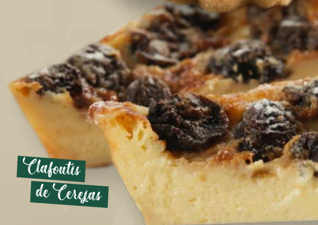
Clafoutis de Cerejas