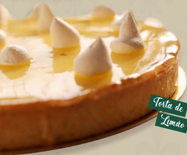
Torta de Limão