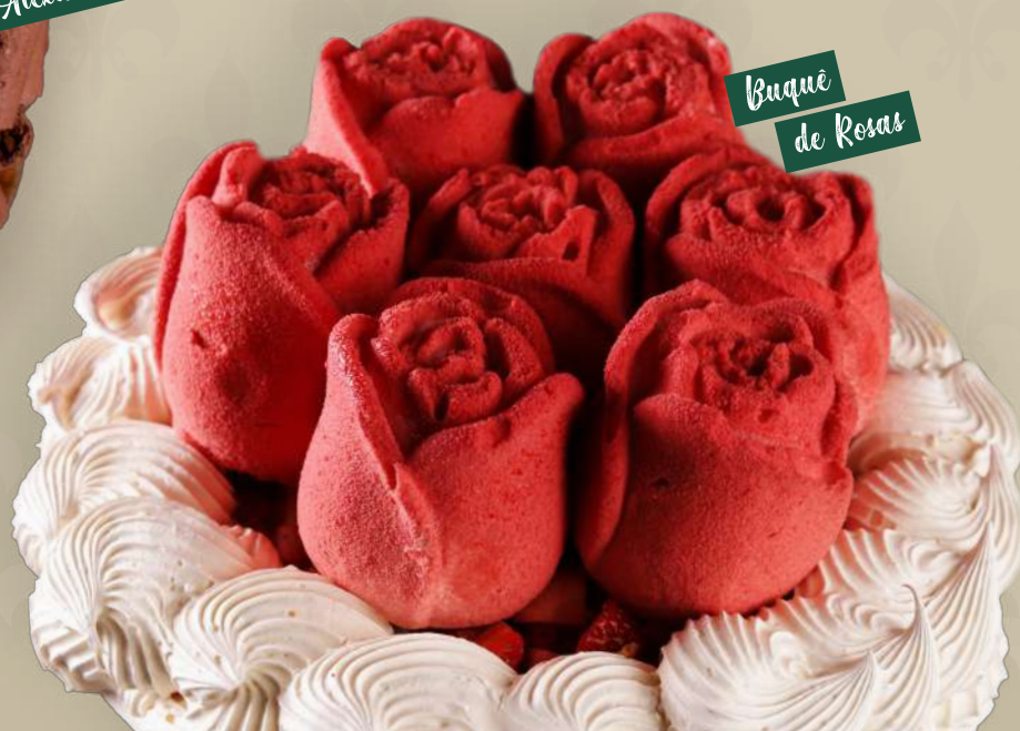
Buquê de Rosas

07 Rosas Chérie (Mousse de Morangos, cremoso de limão e biscoito pistache) em uma base de merengues com creme Chantilly e morangos.