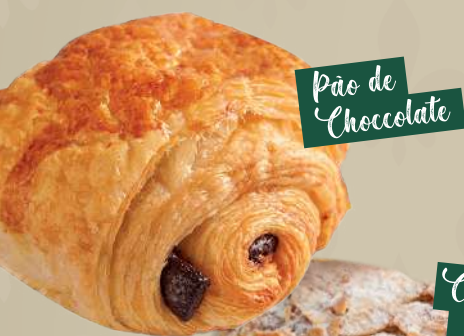
Pão de Chocolate

“Viennoiserie” é o termo usado para definir os produtos cuja técnica de fabricação é semelhante ao pão ou massa folhada.