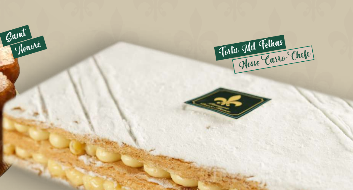
Torta Mil Folhas Nosso Carro-Chefe

10 pessoas ---- R$ 300,00 | 30 pessoas ---- R$ 900,00